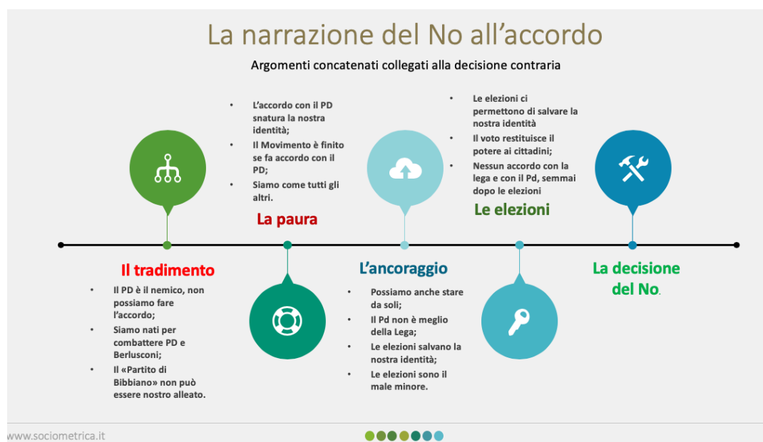
Tav. 5 – La “narrazione” di chi è contrario all'accordo

Fonte: analisi Sociometrica su tecnologia Expert System