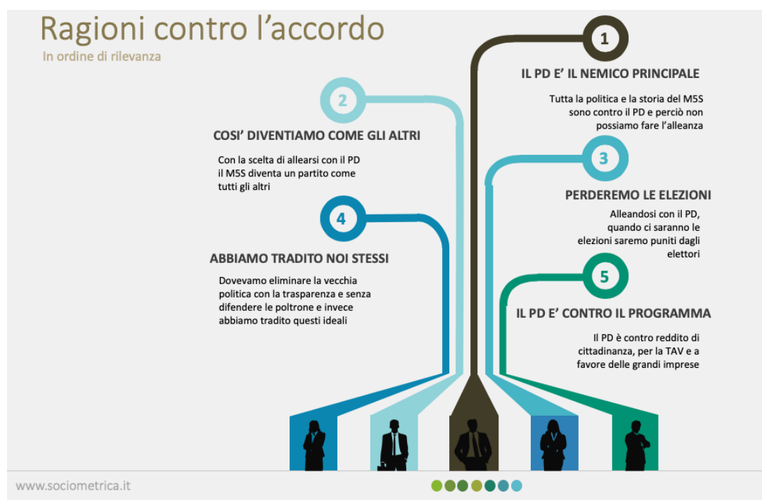
Tav. 3 – Le ragioni principali contro l'accordo M5S - PD