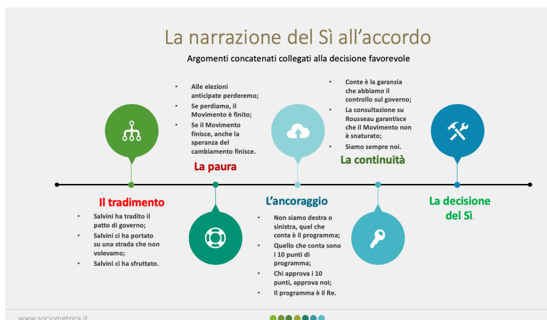
Tav. 4 – Il racconto di chi è favorevole all'accordo