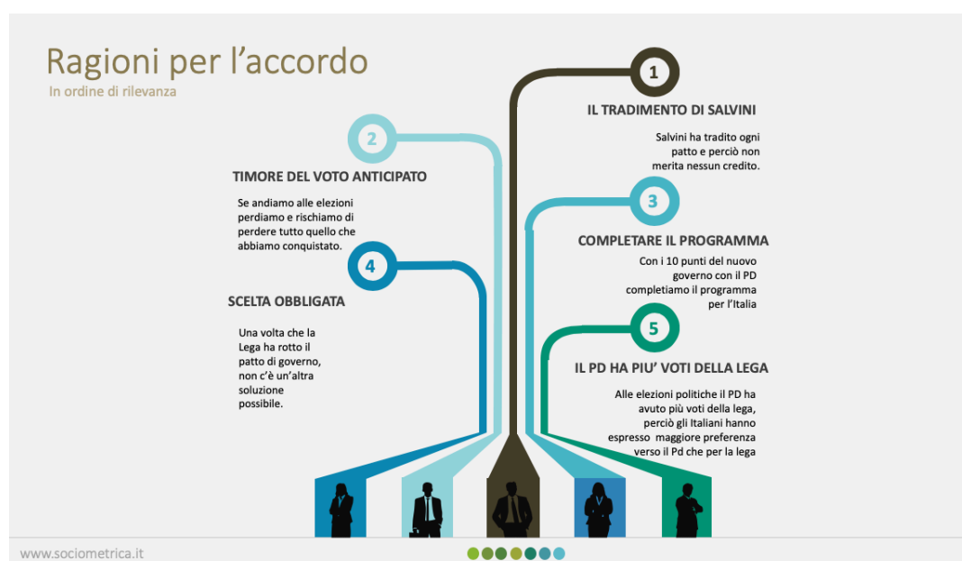
Tav. 2 – Le ragioni principali a sostegno dell'accordo M5S - PD