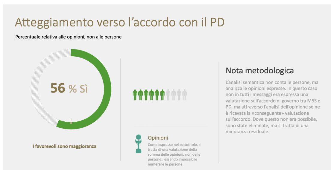
Tav. 1 – Atteggiamento generale verso l'accordo